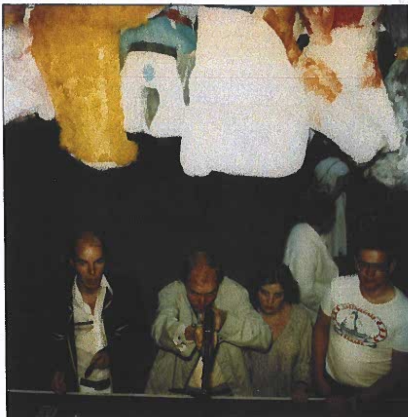
Foto-SchietSalon H. Peters Hoermond Tel. 04760-88602