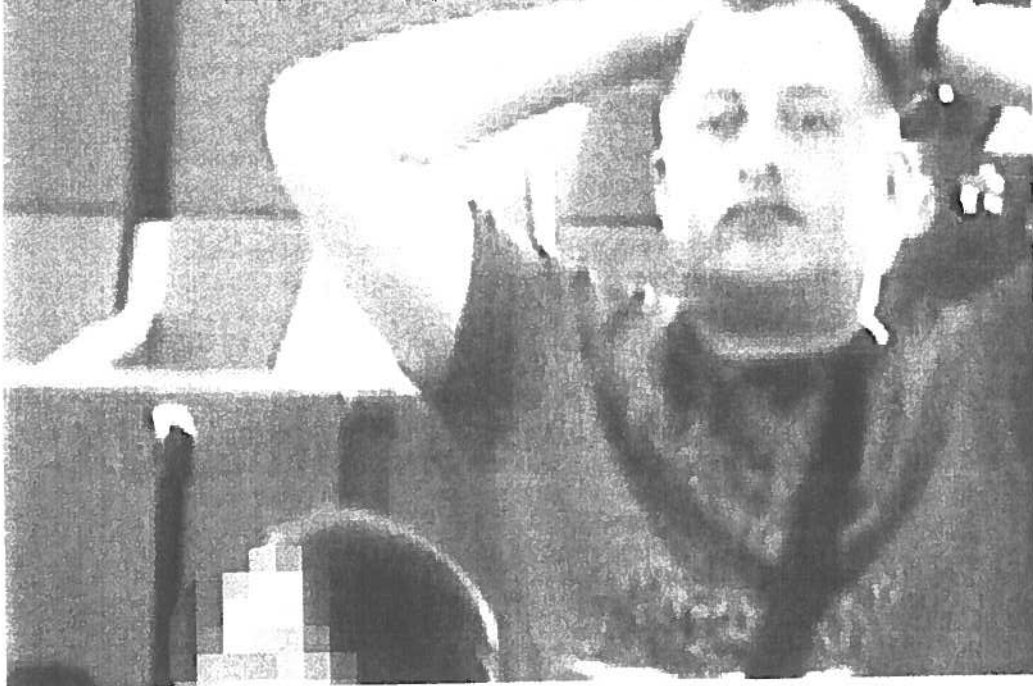
Justitie ziet Sowerby als een radertje in de machine van maffiabaas Robert Dawes.

TESSMONITOR 436 Camera Tessione 10 Zoom Digital: 7x