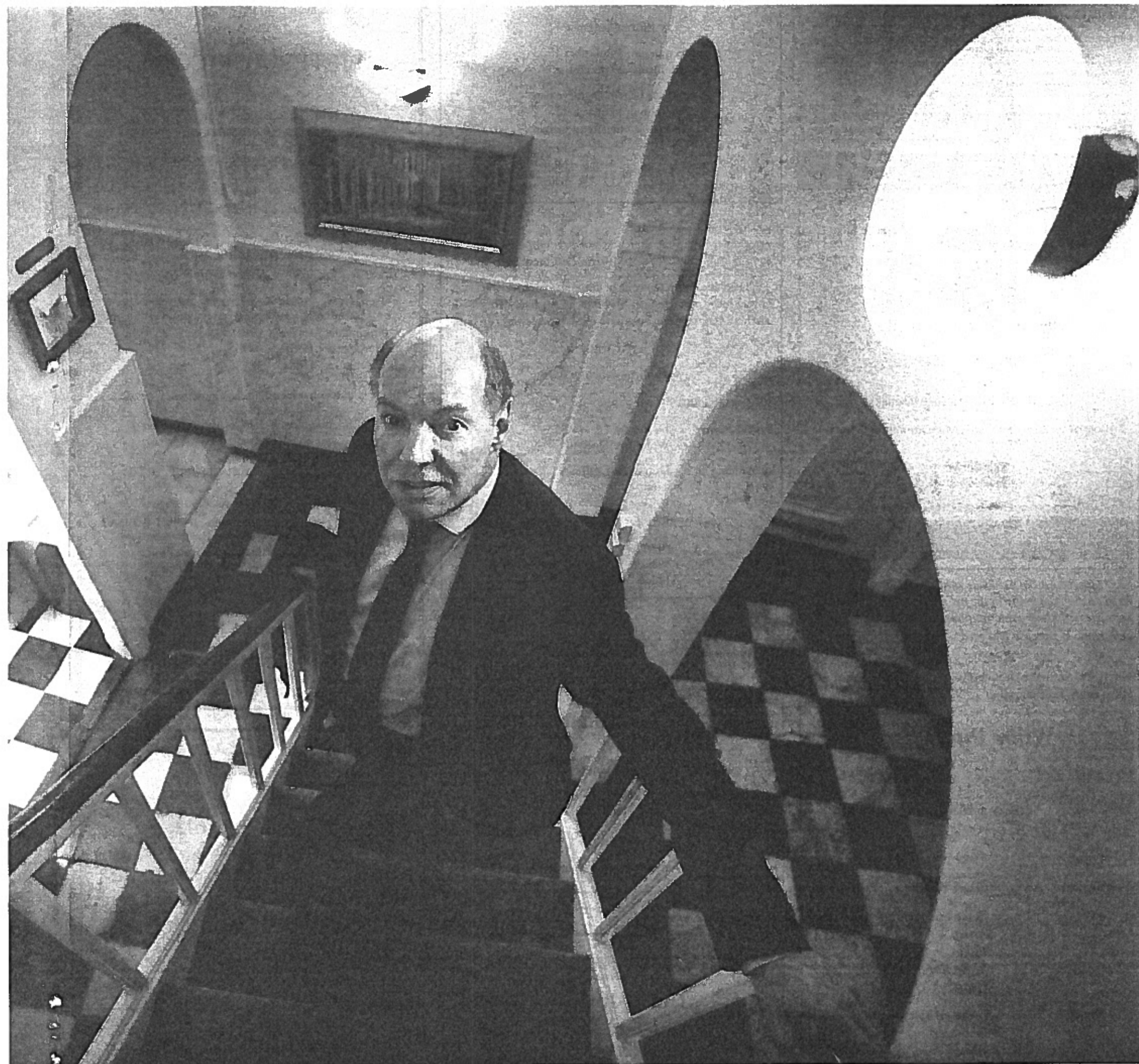
Licht of niet is flinterdun".

ken weigeren vanwege de aard of de ernst van het feit.